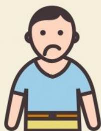
Не может улыбнуться? Уголок рта опущен?