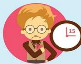
Продолжительность боли более 15 минут