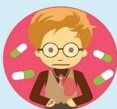
Боль не прекращается после приема нитроглицерина