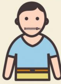
Не может разборчиво произнести свое имя?